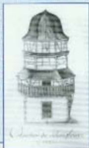
Château de Schweighausen

Dans ses mémoires, ouvrage de référence sur le mode de vie au XVIII m siècle, elle décrit ses voyages et rencontres avant les événements de 1789.